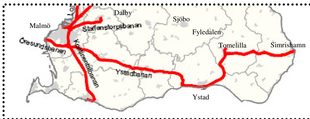
Illustration 2. Södra Skåne med dagens trafikerade linjer utmärkta

I dag trafikeras inte järnvägssträckan ”Simrishamnsbanan” i sin helhet. Mellan Simrishamn och Tomelilla går tåget längs den ursprungliga banan, men vidare mot Malmö går trafiken via Ystad. Sträckan Simrishamn – Ystad elektrifierades så sent som år 2003. Under sommaren 2006 stängdes trafiken eftersom rälsen måste förbättras.